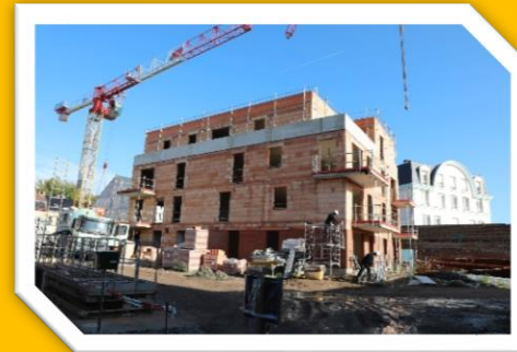
Extension de la maison de retraite