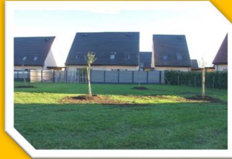
Plantation d'arbres de variétés locales