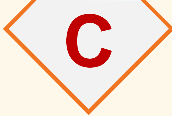
TABLEAU DES INVESTISSEMENTS