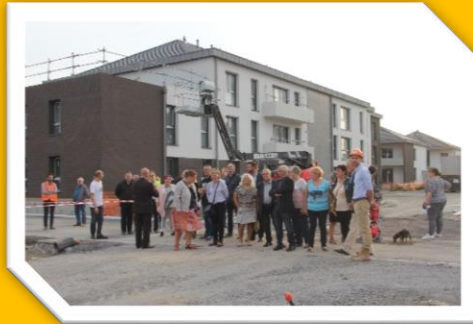
De nouveaux logements