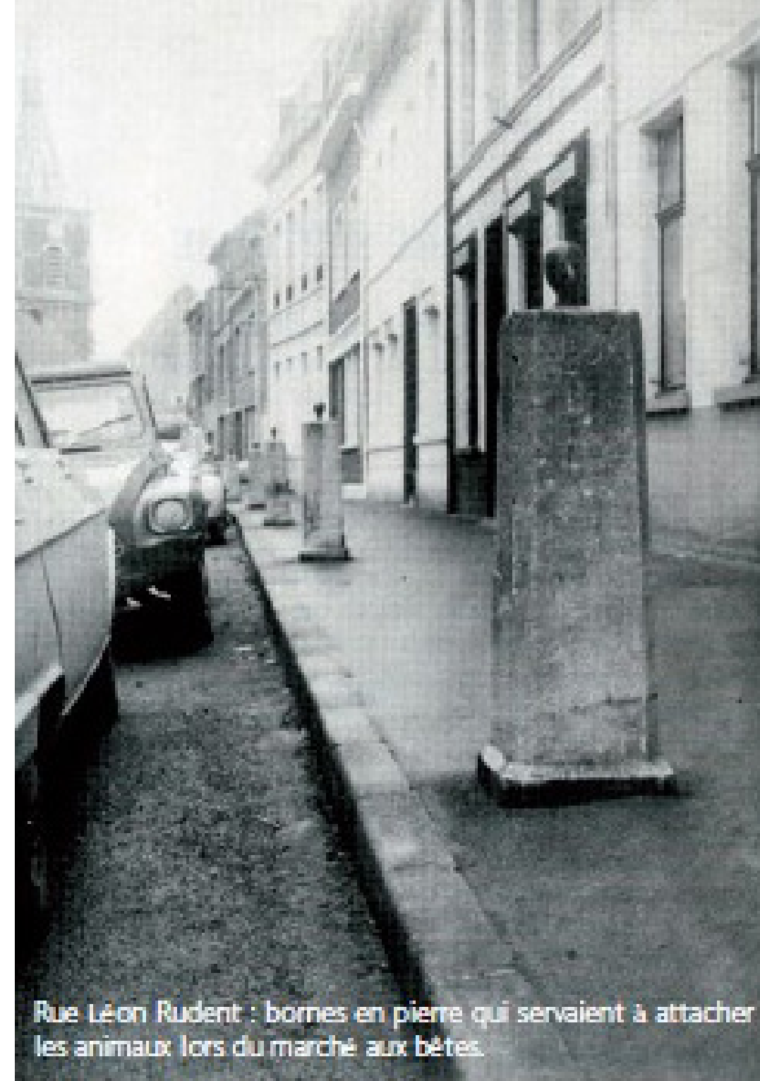
Rue Léon Rudent : bornes en pierre qui servaient à attacher les animaux lors du marché aux bêtes.

Au numéro 49 de la rue Léon Rudent, un petit blason sculpté sous une niche, nous donne un indice de l'ancienne activité du lieu. Avez-vous deviné ? Dans le détail, on discerne une cuve au-dessus duquel s'entrecroisent pelles et fourquets de Brasseur. La maison abritait la brasserie Carlier.